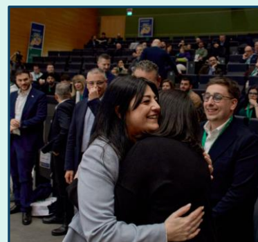
Alcuni momenti dei momenti della seconda parte dei lavori congressuali, immediatamente dopo l'elezione dei componenti della nuova segreteria del SLP CISL Lombardia